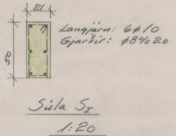
Langjárn: 6φ10 Gjardir: φ8%20 Súla SI 1:20

Yfir bílskúrsdyr leggist 2φ16 Yfir aðrar dyr og glugga 3φ10